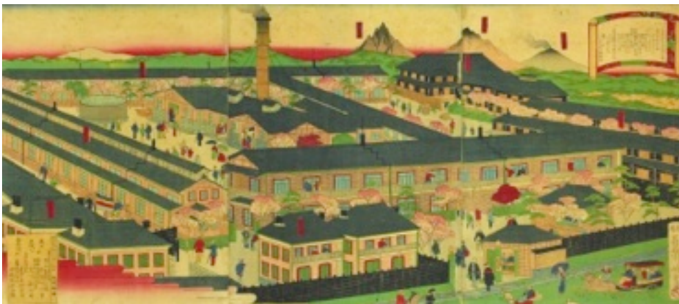
上州富岡製糸場之図 (長谷川竹葉)

今回は、当館所蔵の錦絵の中で最も有名な一枚である、明治9年(1876)に長谷川竹葉が描いた『上州富岡製糸場之図』をご紹介します。長谷川竹葉は、歌川国貞の門人で、明治9年(1876)から明治22年(1889)頃に活躍しました。主に「東京名勝開化真景」のような開化絵の他、団扇絵などを描いたことで知られていますが、作品は余り多くありません。