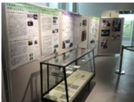
企画展「農工大発 イノベーション・シーズ展」